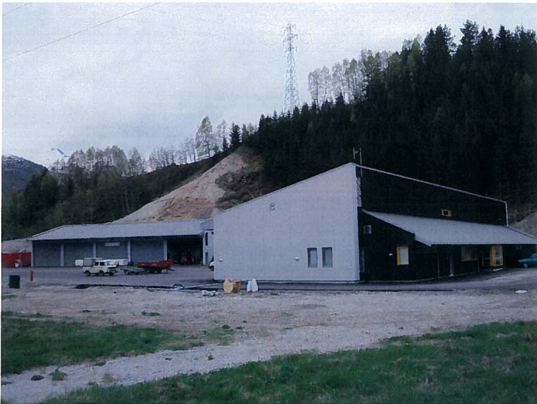
Verkstad, lager og miljøstasjon for FDV og brannstasjon for Valldal teken i bruk haust 2009.